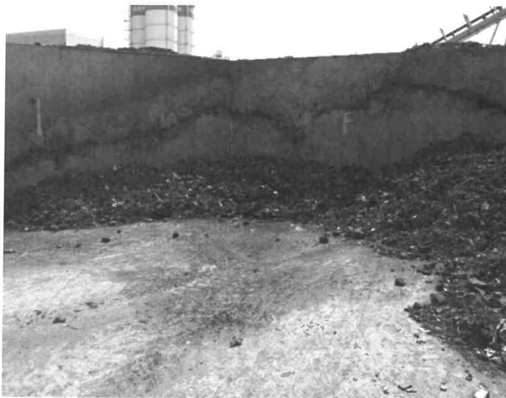
Vue du casier après extinction et après élimination du partie des résidus

Alors que le site est en rétention complète, les eaux d'extinction (environ 30 m 3 d'après l'exploitant) ont été collectées dans le séparateur d'hydrocarbures d'une contenance de 80 m 3 . Le séparateur a été fermé pour éviter tout rejet à l'extérieur. Les eaux contenues dans le séparateur feront l'objet d'analyses avant toute décision concernant leurs modalités d'élimination (rejet ou pompage et traitement). L'exploitant a transmis à l'Inspection des Installations Classées une déclaration de sinistre le 1 juillet 2015 et un rapport d'incident le lendemain.