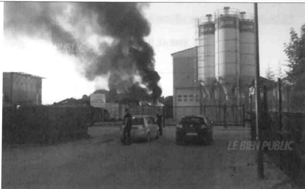
Vue du casier en feu depuis la voie publique